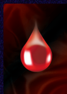
Goutte de sang